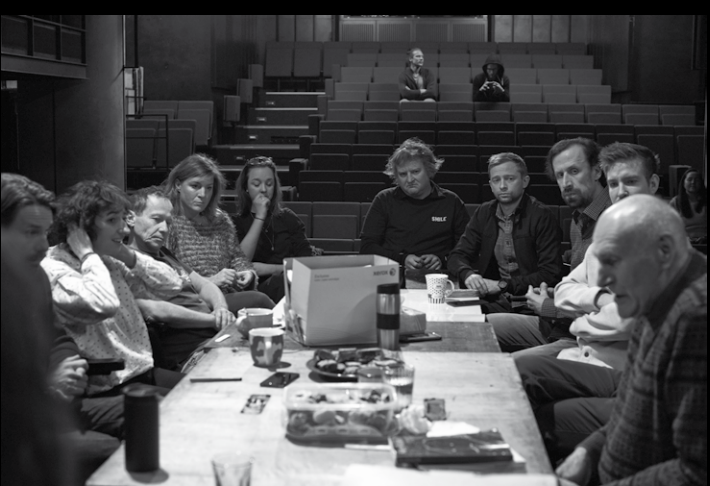
Fotografie jsou ze zahajovací zkoušky 17. ledna.